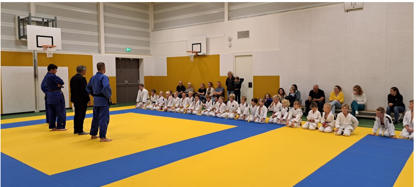
Het Samen Sterk Toernooi 2023 gaat van start!

Het huren van de accommodatie heeft de vereniging ook voordelen gebracht. Zo wordt verwarming, water, elektriciteit etc. betrokken van de verhuurder, en worden ook de schoonmaakactiviteiten door de onderwijsstichting uitgevoerd. Toch blijft het verlies van de kantine en tribunefaciliteiten knagen. Asahi-San streeft ernaar op termijn te beschikken over een eigen dojo. Daartoe heeft zij de van de gemeente ontvangen middelen gereserveerd, al blijft het de vraag of deze toereikend zijn, gelet op de prijzen van vastgoed.