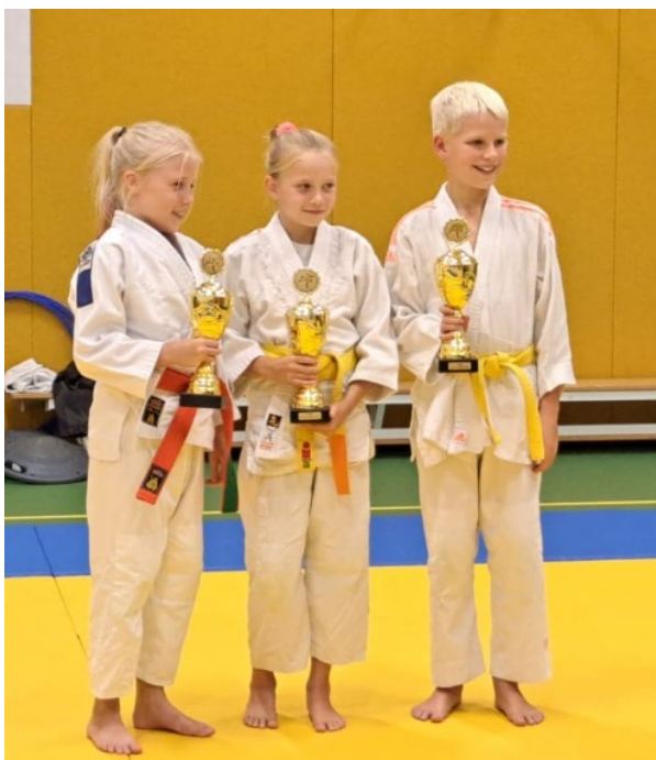
Drie toppers, winnaars van de All Over Competitie 2023

Opvallend gegeven is dat in 2023 17 judoleden afscheid van onze vereniging hebben genomen, maar er toch ook weer 20 nieuwe leden, overwegend jeugdleden, konden worden bijgeschreven! Dit alles roept de vraag op hoe we bestaande leden voor onze club kunnen behouden.