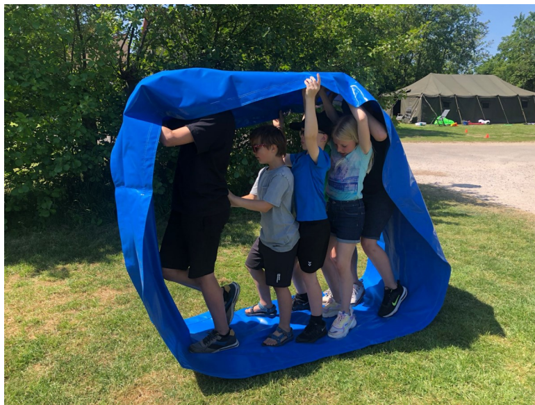
Activiteiten op het Zomerkamp 2023 't Noordersandt, Julianadorp

Net als elk jaar hebben de trainers en vrijwilligers een aardigheidje met de Kerst ontvangen.